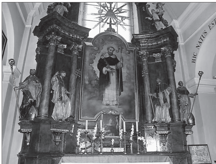
1. kép. A szombathelyi Szent Márton-templom belseje