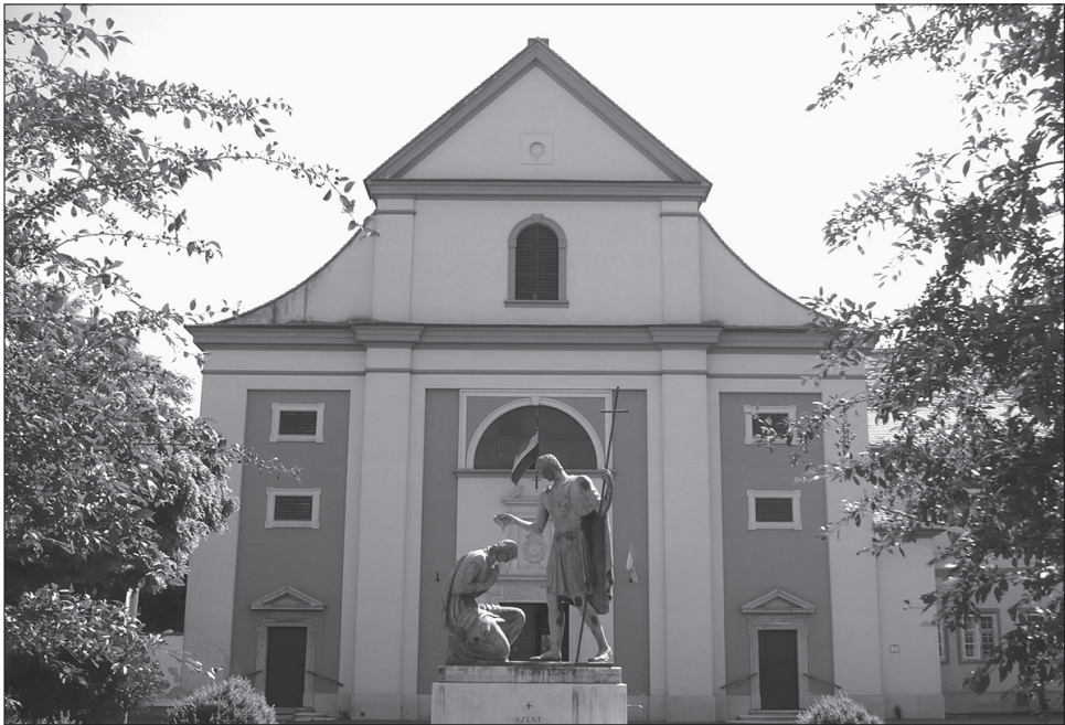
5. kép. Szent Márton kútja napjainkban

2003 és 2007 között hét Szombathelyről kiinduló Szent Márton kulturális út ( Via Sancti Martini ) jött létre (1. térkép). Az egyes útvonalakat többnyire a Szent Mártonnak szentelt, ma is működő templomok, valamint a mára csupán romjaiban létező középkori templomok felfűzésével jelölték ki. A nyomvonalba eső települések egy része nevében is őrzi templomuk védőszentjének, Szent Mártonnak a nevét. Ilyen, a szentről elnevezett települések például: a dél-dunántúli Szilvásszentmárton, Hegy-szentmárton és Alsószentmárton; a burgenlandi Sankt Martin in der Wart (Őriszentmárton) és Sankt Martin an der Raab (Rábaszentmárton); a szlovákiai Martin nad Žitavou (Zsitvaszentmárton); a horvátországi Sveti Martin na Muri (Muraszentmárton) és Donji Martijanec; valamint a szlovéniai Martjanci (Mártonhely) és Šmartno na Pohorju. A tematikus utak létrehozásának célja a Szent Márton-kultuszhoz kapcsolódó vallási és néphagyományok ápolása mellett a kulturális és vallási turizmus fejlesztése, illetve a kulturális örökségvédelem támogatása volt ezeken a Szent Mártonhoz köthető településeken. Szombathely körül a következő, egy kivétellel országhatárokon is átnyúló zarándokutak jöttek létre.