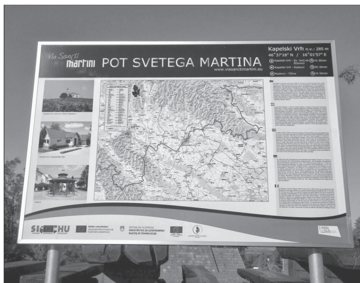
6. kép. Információs tábla a kulturális útvonal szlovéniai szakaszán

Útvonal/Via Divide Caritatem (6 útszakasz). Ezeket az utakat számos okból keresik fel az érdeklődők. Vannak, akik a túrázás örömeért és az ismeretszerzés miatt kerekednek útra, mások a teljesítménytúrák kihívását látják az útban, és megint másoknak a zarándoklat nyújtotta testi-lelki megújulás a célja. Bármilyen legyen a zarándoklatok mögött rejlő motiváció, a Szent Márton utak és a Szombathelyi Szent Márton Látogatóközpont gyakori felkeresése jól illusztrálja, hogy egy 1700 éve született szent kultusza ma is élő, eleven hagyomány, a modern ember életének része lehet. 29