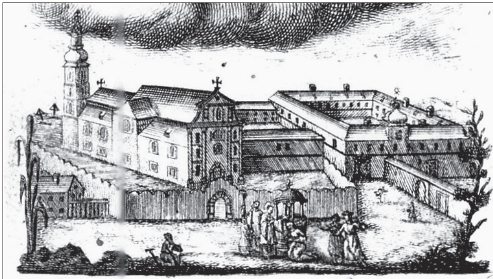
4. kép. A szombathelyi domonkos rendház, előtte Szent Márton kútja egy 18. századi metszeten

A plébániatemplom déli oldalára épült domonkos kolostor 12 falai között működik a 2007-ben megnyílt Szent Márton Látogatóközpont (3. kép), ahol információkkal, vallási és kulturális rendezvényekkel, valamint tárlatokkal várják a Szombathelyre érkező turistákat, zarándokokat és a történelmi értékek iránt érdeklődő látogatókat. 13 A Látogatóközpont kiállításai többek között az alábbi témákat érintik: Szent Márton életútja és kora; régészeti leletek és ötvöstargyak a Szent Márton-templom történetéből; nyugat-dunántúli templomokban fellelhető Szent Márton-ábrázolások (szobrok, festmények, üvegablakok); és a Márton-naphoz kapcsolódó népszokások.