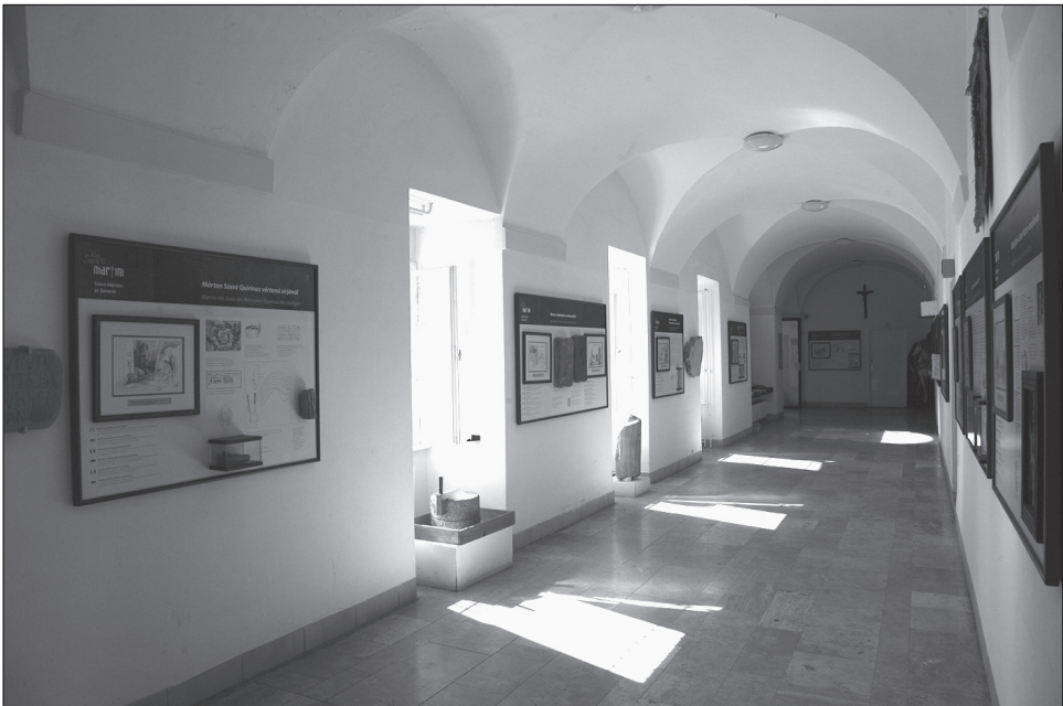
3. kép. Kiállítás a szombathelyi Szent Márton Látogatóközpontban