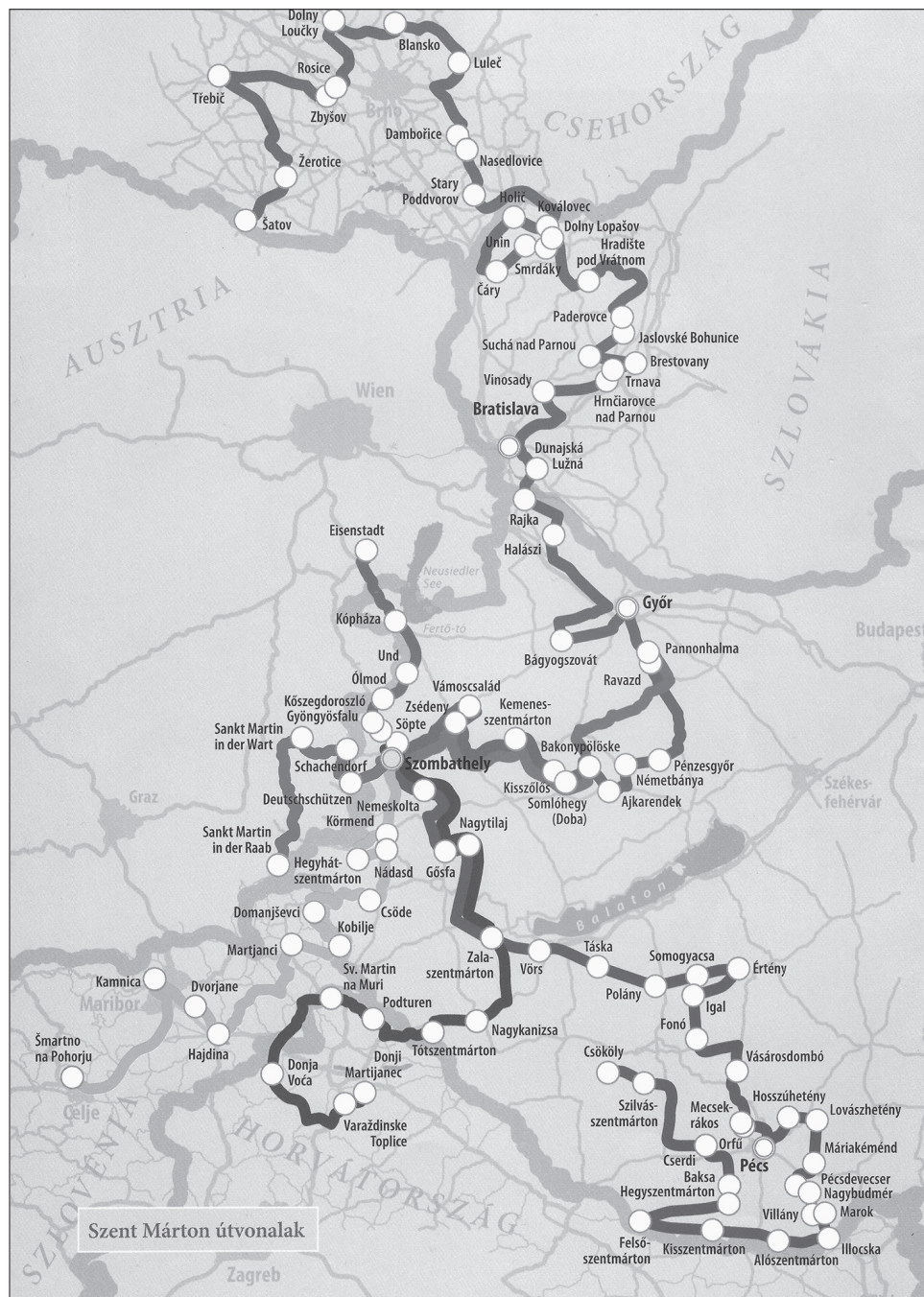
1. térkép. A Szombathelyről kiinduló Szent Márton kulturális útvonalak