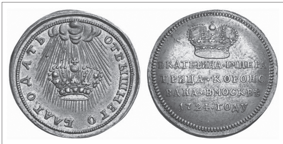
2. kép. Kegyelem a Magasságostól. Katalin koronázására készült érme (1724)

nak drágaköveit is felhasználva, így Katalin koronájának csak az abroncsa maradt ránk –, s aztán Erzsébet is ezzel a fejdíszsel koronázta meg önmagát (1742).