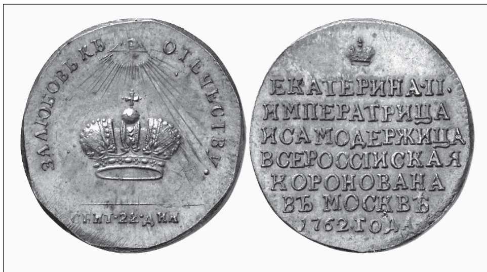
10. kép. A Haza iránti szeretetért. II. Katalin koronázására készült érme (1762)

Erzsébetet az általa kijelölt unokaöcs, III. Péter követte a trónon, akinek rövid uralmát azonban saját felesége, Katalin döntötte meg, ugyancsak a gárda segítségével. Ami II. Katalin koronázási érméit illeti, ezekből három változat ismert számomra, melyekből az egyik az úgynevezett standard típus variációja (10. kép). 50 Ennek előlapján félkörben a felirat a következő: A Haza iránti szeretetért (Za ljubov k Otyecsesztvu) . Ez a képi ábrázolás abban különbözik a korábbi standardtól, hogy egy félkör alakú napkorongból áradnak a sugarak a koronára, a félkör felett pedig egy egyenlő oldalú háromszögben egy szem látható. Ez utóbbi, természetesen, a „mindent tudó, mindenütt jelen levő Istent szimbolizálja”, 51 a háromszög pedig a Szentháromságot. „A szem a háromszögben, amit egy kör fog körbe a belőle kiáradó fénysugarakkal, az egy Isten–Szentháromság végtelen szentségének kifejezésére szolgált.” 52 A Szentháromság efféle ábrázolása, akár valamely említett elem elhagyásával, közhelynek számított a nyugati barokk művészetben, mind a templomokon belül, mind azokon kívül, és szorosan kötődött a közvetlenül Isten által adott uralkodói hatalom, az isteni jogalap eszméjéhez, Nagy Péter alatt pedig az orosz hatalmi ikonográfiában is megszokottá vált. 53