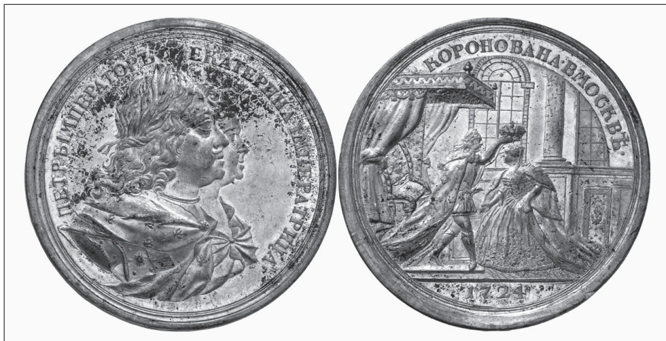
1. kép. Megkoronáztatott Moszkvában. Péter és Katalin a koronázási érmén (1724)