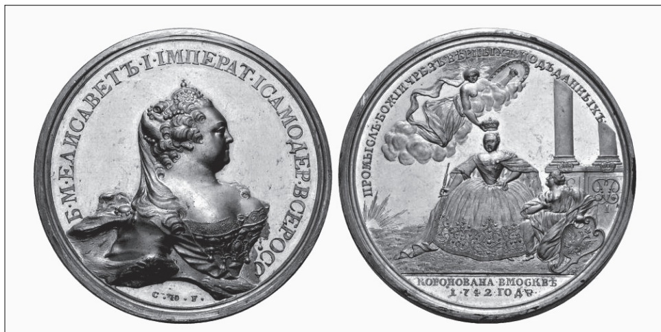
7. kép. Az Isteni Gondviselés a hű alattvalók révén. Erzsébet koronázási érméje (1742)