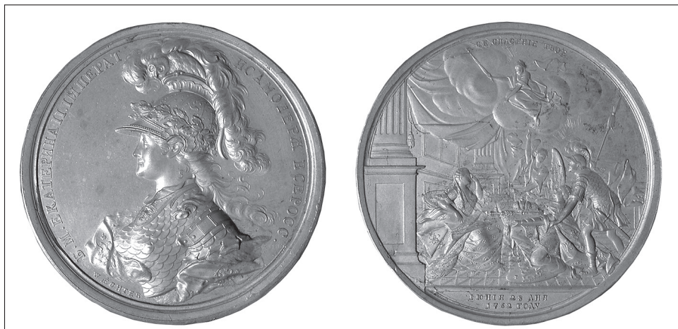
12. kép. Katalin mint Minerva a koronázási érmén (1762)

mányos körfelirattal. A hátlapon alul, bal oldalon ülő nőalak maga Katalin, aki előtt térdre borulva egy másik nőalak látható, mégpedig Oroszország allegóriája, amely az őt támogató Szent Györggyel együtt egy párnán ajánlja fel a koronát és a jogart (tehát a hatalmat) Katalinnak, de ez a nőalak nem is Katalinra néz, hanem felfelé. A korona mögött jobb kezével felfelé mutató angyal látható, aki egy felette levő, felhőben ülő, jobb kezében jogart tartó nőalakra, az Isteni Gondviselés allegóriájára mutat. Legfelül a következő felirat olvasható: Ebben van a te Megváltásod . E feliratot nyilvánvalóan Oroszország vonatkozásában kell értelmezni: így érthető, hogy az Oroszországot megszemélyesítő nőalak felfelé tekint, mintegy az Isteni Gondviseléshez könyörögve. Alul nem a koronázás éve és napja van feltüntetve (a koronázás szeptember 22-én történt, amint az a másik két érmén látható), hanem az a dátum, amikor Katalin megdöntötte III. Péter hatalmát (1762. június 28-án).