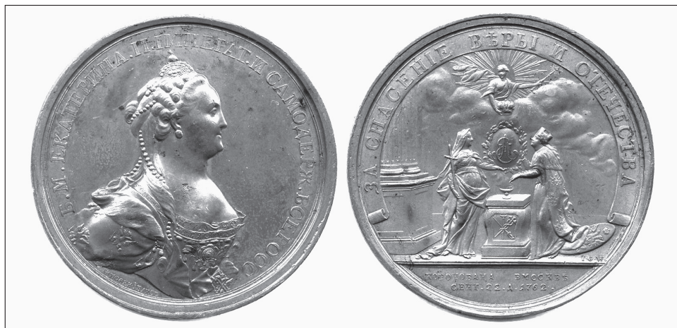
11. kép. A Hit és a Haza megmentéséért. II. Katalin koronázására készült érme (1762)

Katalin második koronázási érméje sokkal kidolgozottabb (11. kép). 54 Averse az ismert modellt követi Katalin arcképével és titulusaival, míg reversén az egyes elemek Erzsébet koronázási érméjét idézik (két oszlop, a mennyből koronát lenyújtó szárnyas alak). Ez nem meglepő, ha tudjuk, hogy Katalin uralkodása több szempontból Erzsébet uralkodásának folytatása volt, 55 így például az uralkodói dicsőítés terén (lásd majd például a Minervához való hasonlítást). A felirat, A Hit és a Haza megmentéséért ( Za szpaszenyije Veri i Otyecsesztva ), a Haza ( Otyecsesztvo ) mint hivatkozási pont fontosságát mutatja. Az otyecsesztvo , mely attól fogva vált fontossá, hogy Nagy Péter 1721-ben felvette az Otyec Otyecsesztva ( Haza Atyja ) címet, Erzsébet alatt jött szélesebb körű használatba. Katalin pedig különös hangsúlyt helyezett arra, hogy magát a Haza Anyja ( Maty Otyecsesztva ) szerepében tüntesse fel: rendeleteinek indoklásában ugyanis állandó elem volt „az anyai gondoskodásra, a haza, valamint alattvalói jólétére való hivatkozás”. 56 Az érme reversén Katalin orosz nevének (Jekatyerina Alekszejevna) kezdőbetűi (Je. A.) szerepelnek egy ovális pajzsban, amit virágkoszorú övez. Ezt az Isteni Gondviselés már ismert alakja koronázza meg, míg a két egymással szemben álló nőalak, a feliratnak megfelelően, a Hit és a Haza allegóriája egy oltár két oldalán. Az előbbit a kezében tartott kereszt, míg az utóbbit a tőle jobbra levő, letett pajzsban levő orosz címer azonosítja.