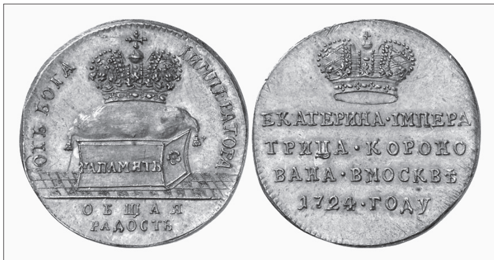
3. kép. Istentől és a Császártól. Katalin koronázására készült érme (1724)

Mivel Katalin 1724-es koronázásának legvalószínűbb magyarázata abban kereshető, hogy Péter őt akarta utódjául a trónon – ami, amint említettem, meg is történt 1725-ben, annak ellenére, hogy a koronázás után Katalin hűtlensége miatt Péternek más terve is volt az utódlás vonatkozásában, továbbá annak dacára, hogy Péter nem jelölte meg konkrétan és félreérthetetlenül, hogy ki kövesse őt a trónon 10 –, így a koronázást úgy tekinthetjük, hogy az tulajdonképpen Péter 1722-es trónöröklési törvényének következménye volt. E rendelkezés szerint ugyanis az uralkodó, tetszése szerint, bárkit kijelölhetett utódjának az alkalmaság alapján.