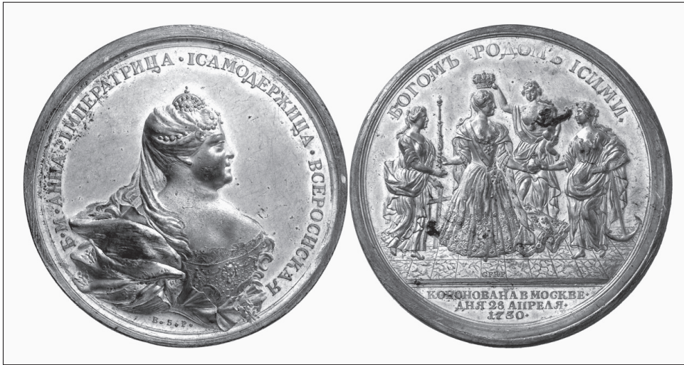
4. kép. Isten, a nemzetség és ezek által. Anna koronázási érméje (1730)

Sokatmondó, hogy Anna koronázási albumának már az első oldalán – a koronázási album új műfaj volt Oroszországban, első ízben Anna esetében találkozunk vele – szerepel a legitimáció első két eleme, ahol Anna kijelentette: „Mindenkinek számára ismert, hogy Isten kifürkészhetetlen irgalma folytán miként léptünk az Összorosz Birodalom örökletes trónjára, és hogy minden alattvalónk hűségesküt tett nekünk, mint igaz és született autokratikus uralkodónak ( Isztyinnoj i Prirodnoj Szamogyerzsavnoj goszudarinye ).” 26 Azaz a koronázási album bevezetője tartalmazza azokat a kritériumokat, amelyek a cárok isteni jogalapjának lényegi összetevői voltak azokban az időkben, amikor az uralkodás még csak kizárólag a férfinem privilégiuma volt : nevezetesen az Isten által adott közvetlen hatalmat, amelyre az örökletes születés jogosít fel valakit, és aki ezáltal igaz, tehát valódi cár (azaz nem álcár). (Ezt állította helyre, amint láttuk, II. Péter is!)