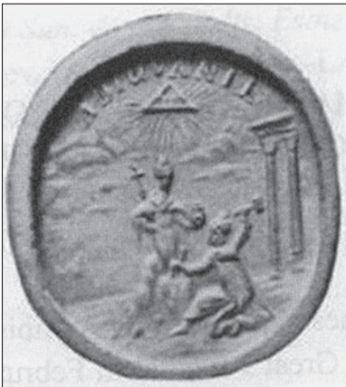
9. kép. Nagy Péter személyes pecsétje

Összegezve: A koronázási érme nemcsak a közvetlenül Isten által adott hatalom elvét nyilatkoztatta ki az Isteni Gondviselés allegorikus alakja révén, hanem tükrözte Erzsébet körének azon törekvését is, hogy hangsúlyozza a trónhoz való jogát, mint Péter és Katalin lányának.