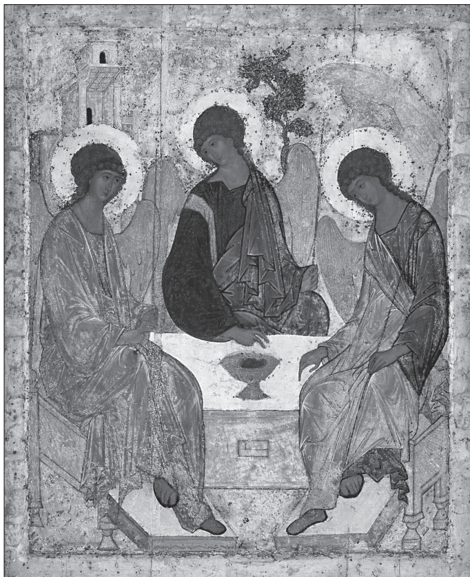
6. kép. Szentháromság (Andrej Rubljov ikonja)

nőalak három gyermekkel szerepel, míg egy másik leírásában mindössze egyetlen gyermeket említ Ripa, akita a nőalak bal karjában tart – ugyanúgy, mint ahogy az érmén és az albumban levő rajzon is látható. 33