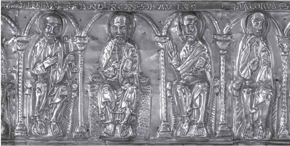
3. kép. Szent Zsigmond ereklyetartója a Saint-Maurice d'Agaune-apátság kincstárából (részlet)

litikai aktualizálásába és spirituális, művészeti átalakulásába a svájci Saint-Maurice d'Agaune-apátság ereklyegyűjteményén keresztül. A kiállításon látható 19 ötvösretek, a pompás textilek és írott források segítségével megértjük, miért vált a fekete katona a Német-római Császárság védőszentjévé, és hogyan inspirálta erkölcsi példamutatása, rendíthetetlen embersége a későbbi korok keresztényeit a császároktól a szerzetesekig.