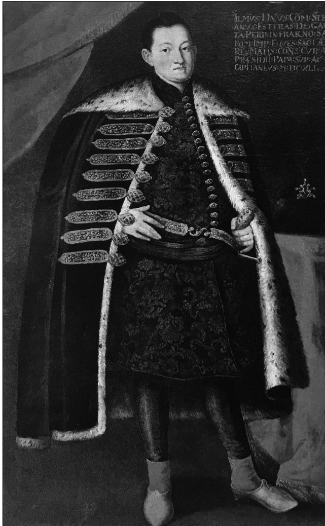
Esterházy István. Portré, 1641.

nálta a portrék készítését és cseréjét a családtagok közötti érzelmi kötődések formálására. Ez fontos képesség volt egy olyan világban, ahol a magas halandóság miatt a korán elhunyt házastársak pótlására szinte rutinszerűen került sor. Esterházy Miklós elsőszülött fia, István, megtanulta édesapjától a leckét: felnőttkorában ő maga is ügyesen használta a portrékészítést személyes identitása és családi szerepei bemutatására. 1641-ben, édesanyja halálát és egyetlen leánya márciusi születését, illetve pápai főkapitányságra történő ki nevezését követően megfestette a maga portréját. 3