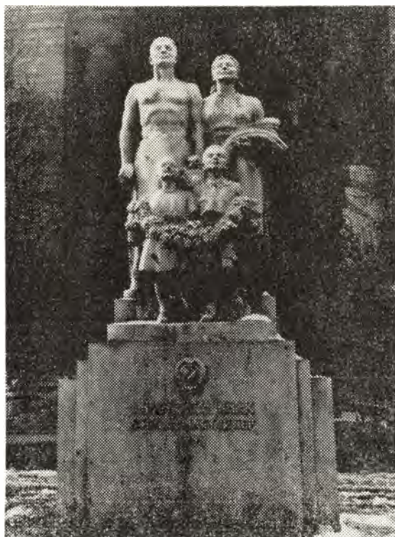
A nagy Sztálinnak a hálás magyar nép

A kutató morzsákat — reméli: mozaikköveket — rakosgat egymás mellé. Tudja: részletgazdaggá ez a kép már csak a bevezetőben említettek miatt sem válhat, erővonalakat jelez csupán, súlypontokat, a propaganda más műfajaiban is gyakran használt, nyomatékkel ejtett vagy kurzívval szedett szavakat, fogalmakat. Szó szerinti értelemben véve is „súlyos” szimbólumok ezek. A köznapi emberhez úgy kívántak szólni, hogy mondanivalójukat a végsőkig leegyszerűsítették. Rávilágítanak ezáltal arra is, mennyire tartotta az adott kor, mely pedig névleg mindent a nép nevében tett, az utca emberét. 22