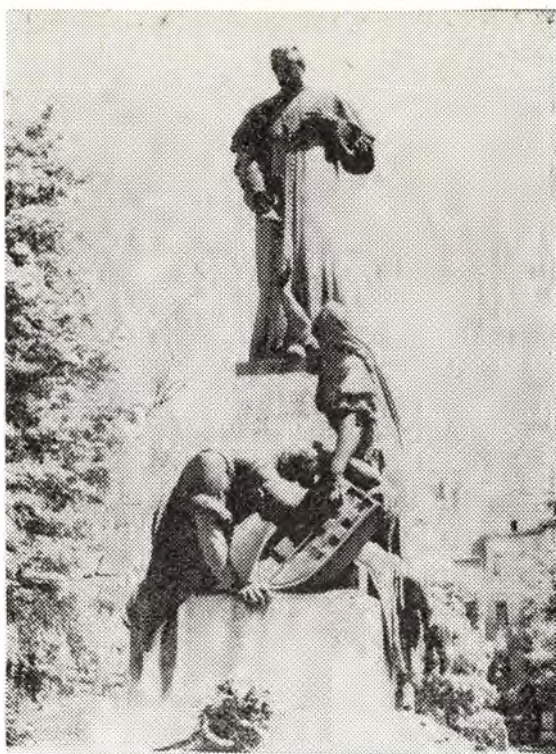
Prohászka Ottokár szobra

állították fel őket. [Pázmány Péter szobra pl., mely eredetileg a Kígyó téren (később Apponyi, ma Felszabadulás tér) állt, végül a Horváth Mihály téri templom elé került.] A legnagyobb vihart e téren Prohászka Ottokár püspök Károlyi-kerti szobrának 1947. április 26-ról 27-re virradó éjjelen történt ledöntése okozta. A szobor már addig is több csonkulást szenvedett: mellékalakjai az ostromban megsemmisültek, 1945 szeptemberében pedig leszerelték talapzatáról az Egyesült Keresztény Nemzeti Liga megalapítását ábrázoló domborművet. A szobordöntés ügyében a nyomozást a Belügyminisztérium államvédelmi osztálya folytatta le, így eredményéről semmit nem tudunk. A földön heverő, letört fejű szobor, majd elszállítását után a talapzat még sokáig búcsújáró hely maradt, ahová virágot vittek, gyertyát gyújtottak az emberek. A szobrot a főváros javíttatta meg, de azután 1947 augusztusában átadta a budapesti érseki helytartóságnak „azzal a kívánsággal, hogy annak elhelyezése csakis olyan területen lehetséges, amely területet az egyház birtokol.” 13