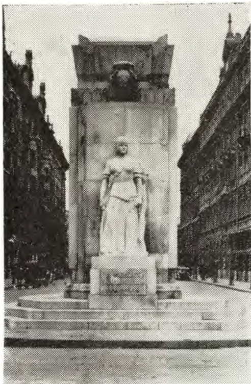
Nemzeti vértanúk emlékműve, 1918—1919