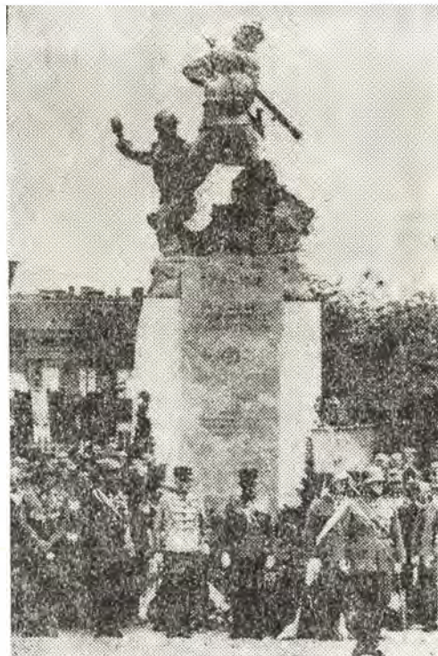
Az 1. honvéd és népfelkelő gyalogezred emlékműve

szobor mellett többek között Rudolf trónörökös, Erzsébet királyné és Bartha Miklós emlékművét.