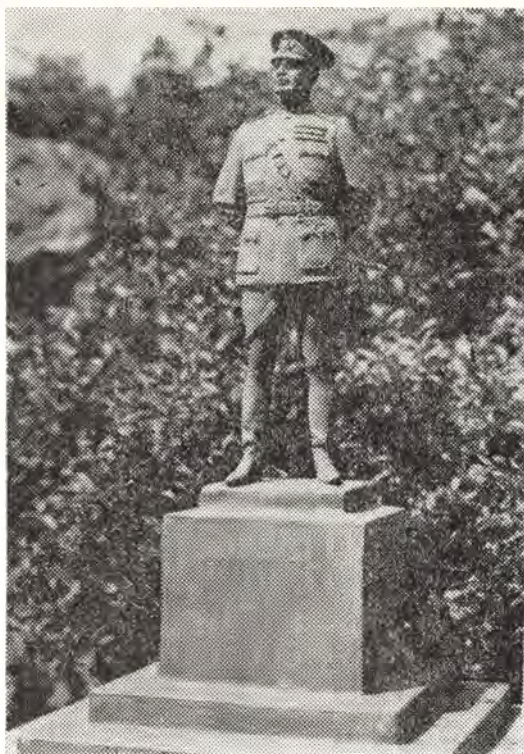
Harry Hill Bandholtz szobra