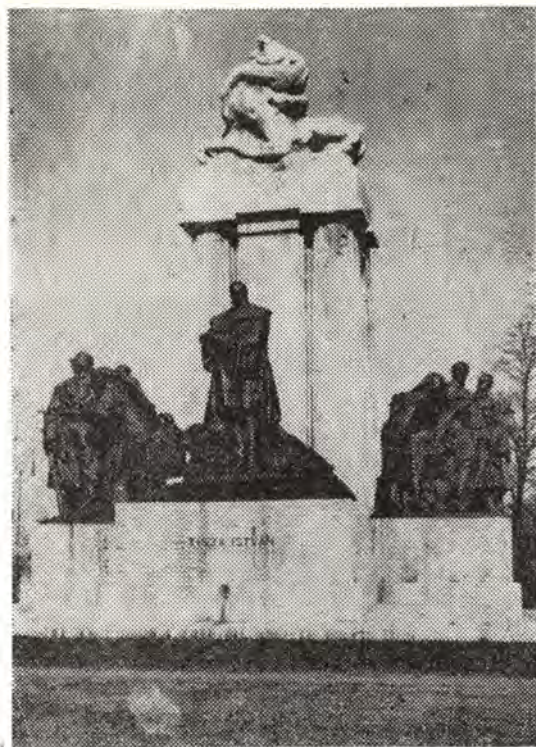
Gróf Tisza István emlékműve

fővárosban. A lebontás vagy helyreállítás ellenben egyértelműen politikai gesztus, hiszen — ugyanezen szűkös időkben — mindkettő jelentős anyagi ráfordítást igényelt.