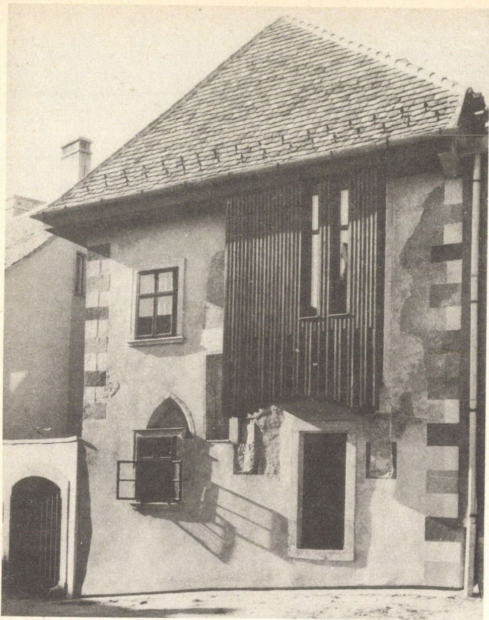
5. ábra: Sopron, Pozsonyi út 3.