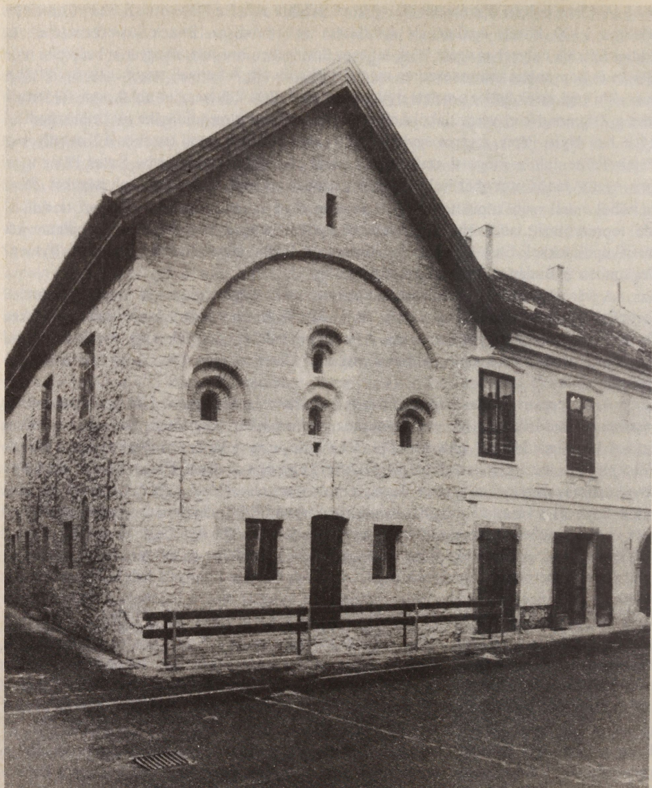
2. ábra. Székesfehérvár Zalka Máté u. 6.