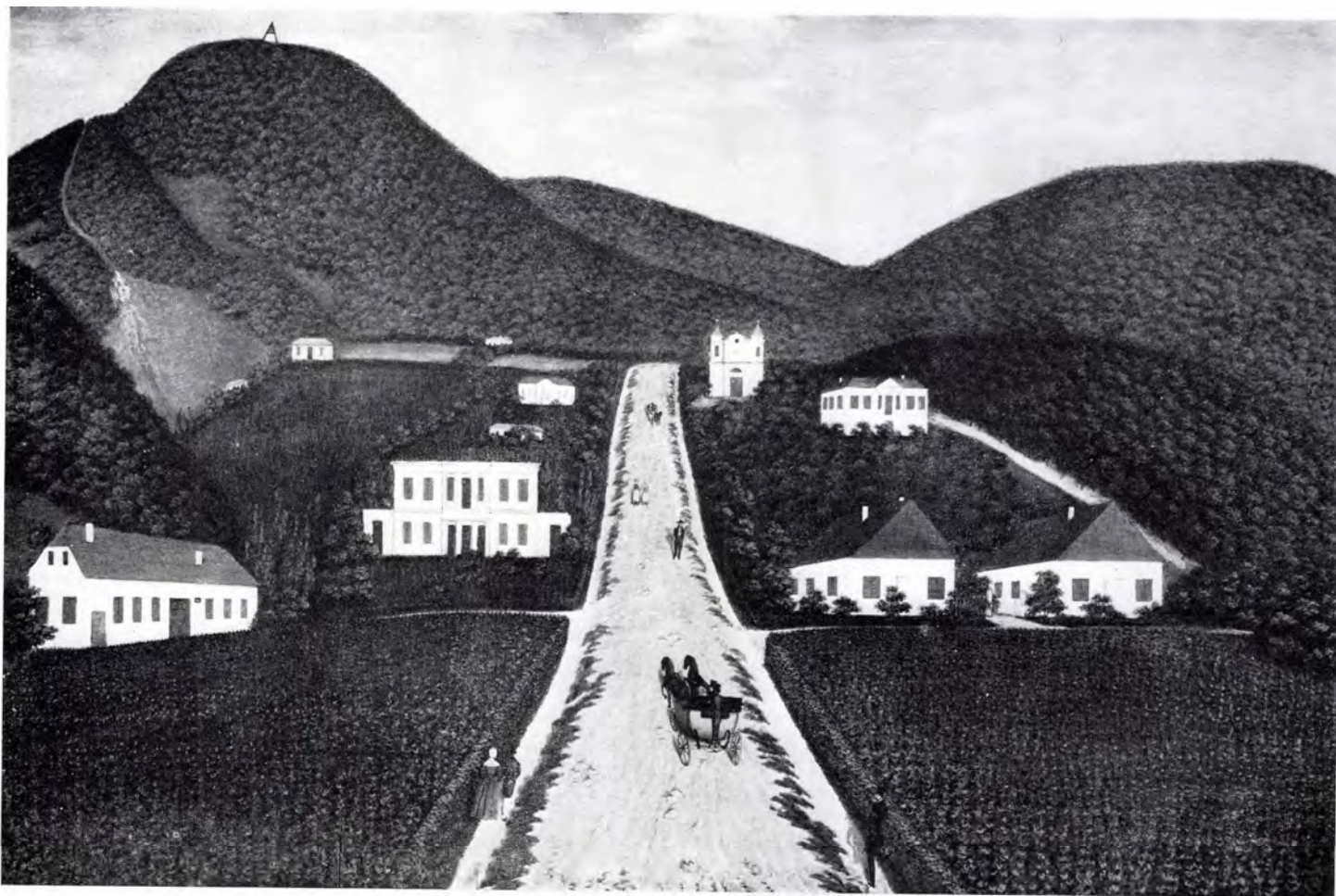
3. Liebrich (?) 1844 körül készült vízfestménye a Budakeszi út egy szakaszáról (BTM Kiscelli Múzeum, Szöllősy Miklósné reprodukciója)