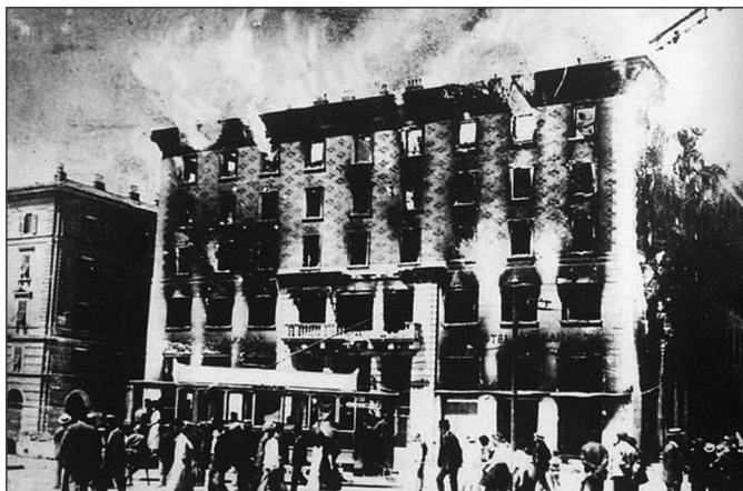
1. kép. A Narodni Dom felgyújtása, 1920. július 20.

fele” titulust). Védelmezői szerepét – több ellentmondással – az ezeréves latin civilizáció örököséiként az olasz hazafiak felsőbbrendűség-érzésére alapozta a vadembereknek tartott szlávokkal szemben.