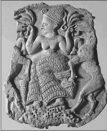
2. kép. Asera (Elefántcsont, i. e. 14. század)