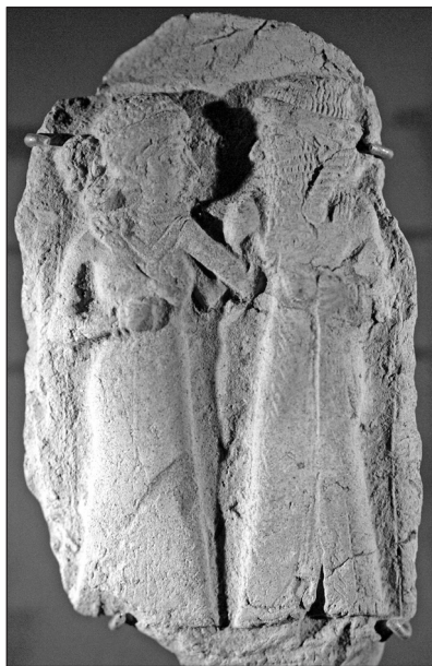
1. kép. Inanna és Dumuzi

hangzatos című sumer, A nagy égből a nagy föld felé... kezdetű változat. 2 Erkezése után az alvilág törvényei szerint Inanna halottnak minősül, tetemét pedig karóra akasztják. A történet akkád változatában Ereskigal az alvilág börtönébe veti, és ettől fogva a földön megszűnik mindenféle szexuális vágy és aktus – az állatok és az emberek között egyaránt. 3 Bár Enki isten közbenjárásának köszönhetően Inanna megmenekül, az alvilág törvényei szerint saját maga helyett mást kell odaküldenie. Választása férjére, Dumuzi – bibliai nevén Tammúz – pásztoristenre esik, aki az istennő véleménye szerint nem gyászolta felesége halálát (1. kép). Végül egy nagyobb szöveghiány után azt olvassuk, hogy fél évig Dumuzi, fél évig annak nővére, Gestinanna lesz Inanna helyettesítője az alvilágban.