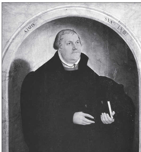
3. kép. Ifjabb Lucas Cranach Luther-képe, 1546 (részlet)

netéhez. A ciszterci apácák számára alapított egykori Szent Kereszt-kolostor és templom épülete évtizedek óta kultúrtörténeti múzeumként funkcionál. Ennek falai között helyezték el a kiállítást, a stralsundihoz hasonlóan itt is az állandó kiállítás mellett. A 16. század második felében a város és a tartomány már jó ideje az evangélikus egyház berendezkedését követte, de az apácák ragaszkodtak régi hitükhöz, vagy inkább megszokott életvitelükhöz. Az evangélikus polgárságnak és a nemességnek azonban éppúgy gondoskodnia kellett a reformált egyház szokásai között felnevelt, de férjhez nem adott lányaik életéről, mint elődeiknek. Egy tartományúri rendelettel 1584-ben a kolostort női társközösséggé szervezték, a falak között élő nők élete azonban nem sokat változott, gyakorlatilag kolostori életet éltek, csak ettől kezdve az evangélikus hitvallás szellemében. A közösség egészen a 20. századig fennmaradt.