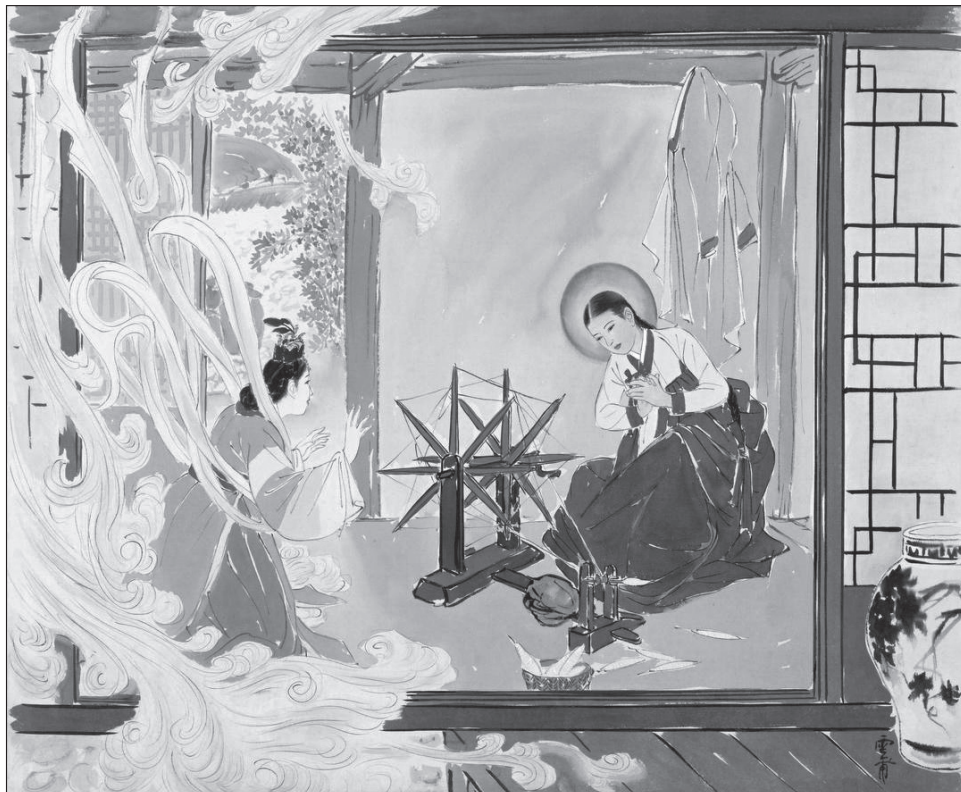
5. kép. Angyali üdvözet Kim Ki-csang képén

több mint nyolcvan százaléka látogatja folyamatosan az istentiszteleteket. Európai szemnek különleges látványt nyújtott egy koreai festő harminc képből álló, a múlt század ötvenes éveiben készült, Krisztus életét ábrázoló sorozata, ahol az újtestamentumi jeleneteket hagyományos ruhába öltözött koreaiak jelenítették meg (5. kép).