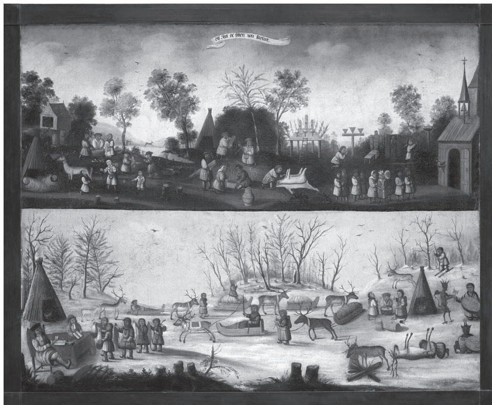
4. kép. Ezek a Lappföld szokásai című kép, 1668

harmincéves háború sanyarúságai nyomán keletkezett nemzeti elfogultság köszön-e vissza ezekben a termekben, vagy valami más, azt nehéz eldönteni. A reformációnak nem volt egyetlen „arany útja”, minden országban más és más módon valósult meg, miként az országok is különböztek egymástól. Aki a kiállítás svéd részét végignézte, egy rideg és intoleráns katonaállam, egy afféle északi Spárta képeit vitte haza emlékül. Brandenburg, a későbbi Poroszország fővárosában mindenestre pikánsnak tetszett ez a beállítás.