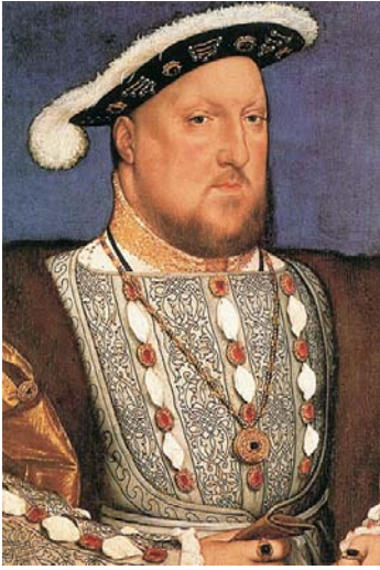
VIII. Henrik angol király. Ifjabb Hans Holbein festménye, 1536

1530. november 29-én meghalt Thomas Wolsey érsek, angol kancellár. Koholt vádak alapján, VIII. Henrik (1509–1547) angol király parancsára perbe fogták, és Leicester városából szállították Londonba, amikor Wolsey a hintóban