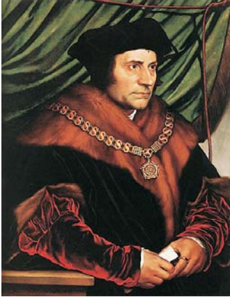
Morus Tamás. Ifjabb Hans Holbein festménye, 1527

gáért cserébe szívesen kölcsönözne előre pénzt Szapolyainak. Sem az 1529-es török hadjáratot követően (amely ékesen bizonyította Szapolyai János szövetségét a szultánnal), sem Thomas Wolsey letartóztatása és halála után nem szakadt meg a kapcsolat a két király között. A következő kancellár, Thomas More